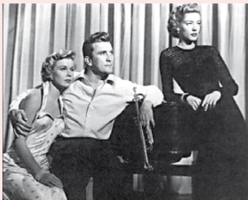
Doris Day, Kirk Douglas i Lauren Bacall

PROJECCIÓ: "EL TROMPETISTA" de Michael Curtiz. Amb Kirk Douglas, Lauren Bacall, Hoagy Carmichael i Doris Day